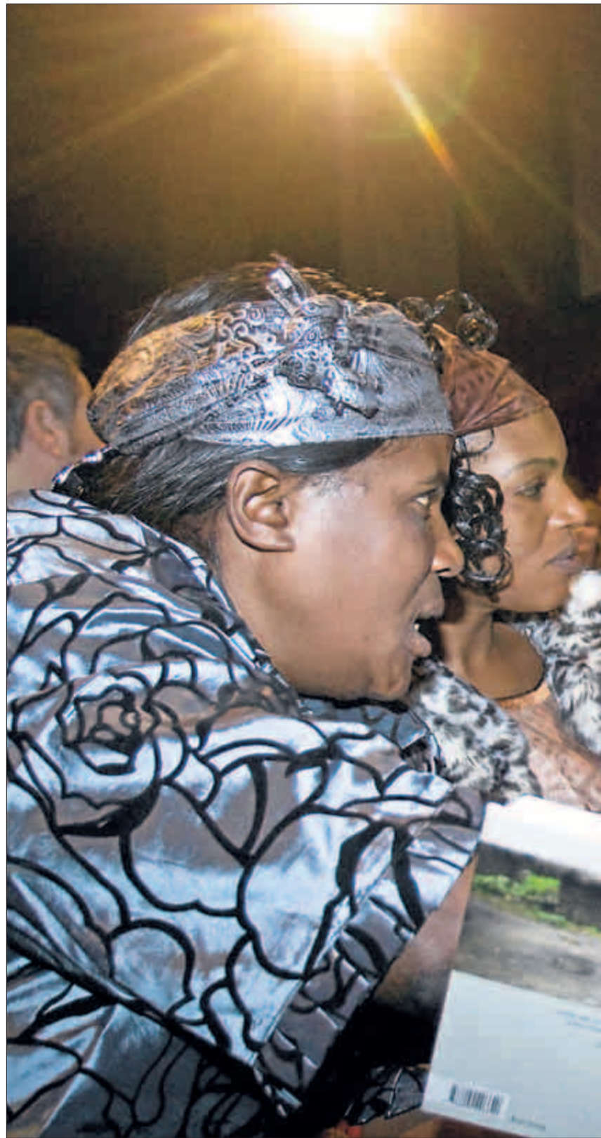
MED PÅ LANSERING: Utenriksminister Jonas Gahr Støre var en av innledderne under lanseringen

ANDERS ANUNDSSEN (FRP), LEDER I KONTROLLKOMITEEN